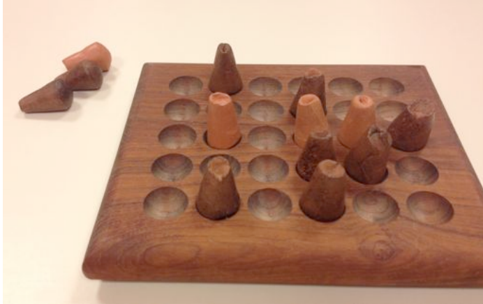
Plateau de Yoté en bois avec des pions en terre (Ecole de Chevroux)

Il est plus complexe de construire un plateau en bois avec des trous, mais le jeu est également possible sans ces trous, ce qui permet de jouer sur un support cartonné par exemple.